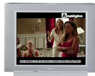
Canal analógico (conteúdo 16:9 Letterbox)

A TV Globo liberou a utilização de toda a área da imagem 16:9 em suas produções e para o mercado publicitário. Dessa forma, todo o conteúdo produzido em HD é exibido sem cortes no canal analógico.